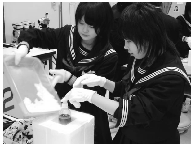
写真2 雪の結晶モデル作り

続いて、雪の結晶モデル作りとして、ペットボトルを使った平松式 *6 の人工雪発生装置を活用して生徒の興味を喚起する実験(写真2)を取り入れた。