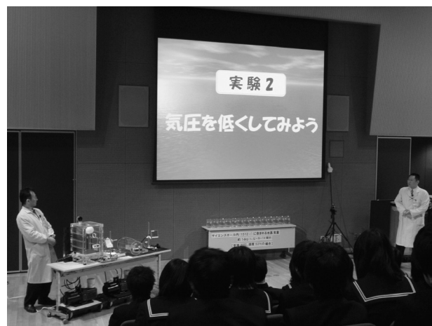
写真1 サイエンスホールでの授業風景

「天気」の単元は中学2年生を対象にして、露点の定義や雲の発生や前線の移動などの演示実験や集中豪雨・干ばつなど自然災害写真の提示と解説を1時間目の授業(写真1)として行った。