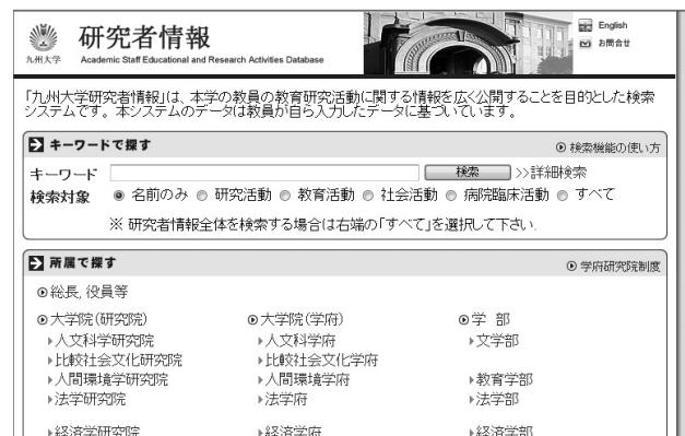
図3 九州大学の研究者情報検索画面

理科教員の多くは、生徒の興味や関心を高める目的や自身の知識の向上を旨として、大気現象に限らず種々の自然現象に関する情報収集をしていると推測できる。小中学校の学習指導要領にも、気象や自然環境の変化と災害などと人間生活を関係づけて考察する学習が記されていることから、科学館でも気象に関する最先端の研究で自然災害にも関連する事例の情報を探すことにした。著者は九州大学総合研究博物館の協力研究員として、九州大学での研究成果を初等・中等教育の理科において活用できないか検討を進めている。