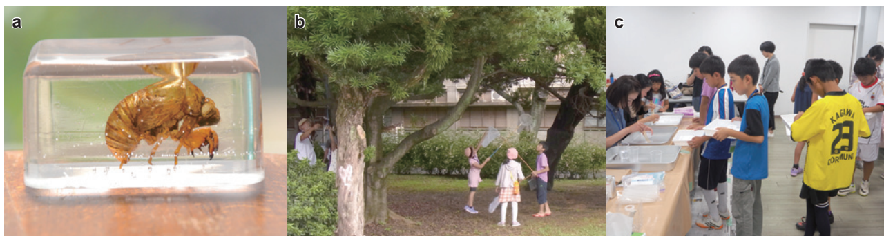
図3 「セミのぬけがら樹脂封入教室」

a. クマゼミのぬけがらの「封入標本」。b. 標本にするセミのぬけがらを自身で採集。c. セミのぬけがらを入れた容器に、プラスチック樹脂を注ぐ。