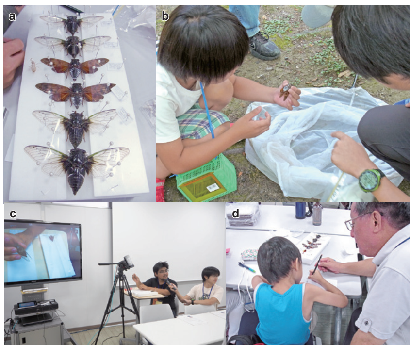
図2 「セミの標本教室」

a. 作製したセミの「昆虫標本」。b. 標本にするセミを自身で採集。c. 学生による標本作製方法の説明。d. ボランティアによる指導。