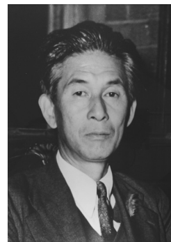
Fig. 1. Dr. Teiso Esaki.

（Fig. 1）。本稿ではこれらの標本の再同定を行うとともに、所蔵の経緯について論じた。標本の再同定にあたっては Carpenter (1988)、Myers (1999) および中坊 (2013) を参照した。発見された標本はすべて九州大学総合研究博物館魚類標本 (KYUM-PI) として登録した。