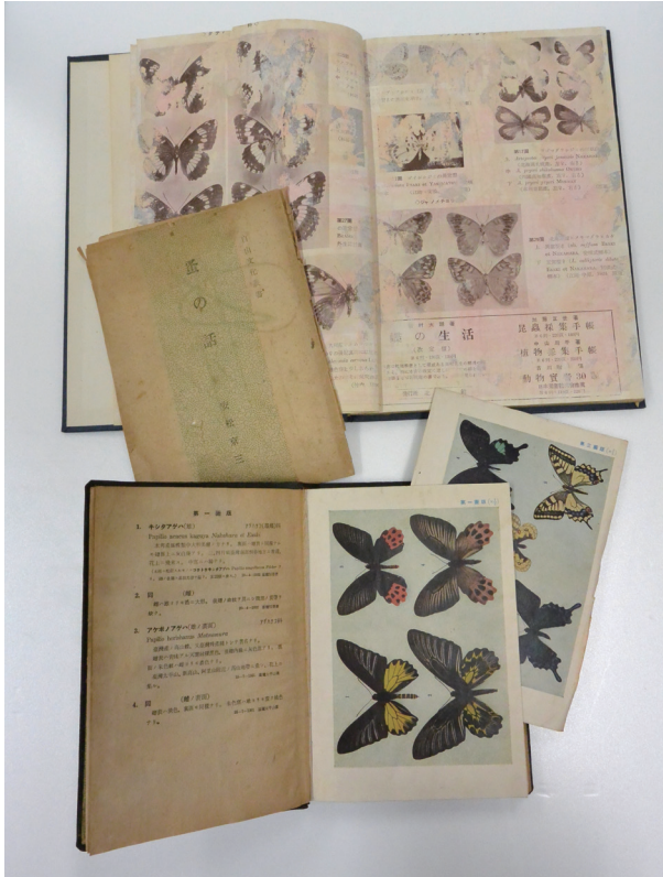
図5 経年劣化および水害による被害

印刷面の著しい汚れや変色，用紙の劣化，ページの脱落などが見られる。上から，江崎梯三・白水隆『日本の蝶』（『新昆虫』4北隆館，1951），安松京三『蚤の話 自由文化叢書』（惇信堂，1946），平山修次郎『蝶類図譜』（三省堂，1942）。