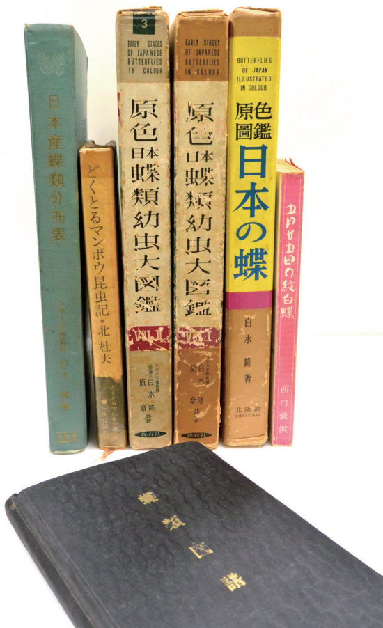
図1 大塚勲氏随想「虫の本と私」(「昆虫と自然」17(3) : 44, ニュー・サイエンス社)で紹介された書籍 (寄贈書籍中に存在したもの)

*大塚 (1982b) によると1982までに発表された報文は約200報である。